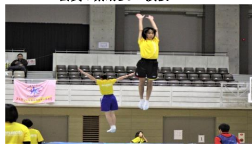
会員の素晴らしい演技