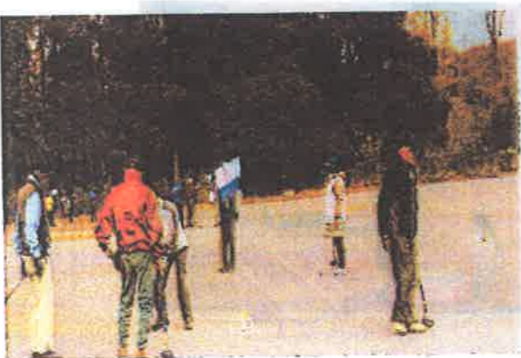
シニア振興事業 グラウンドゴルフ大会