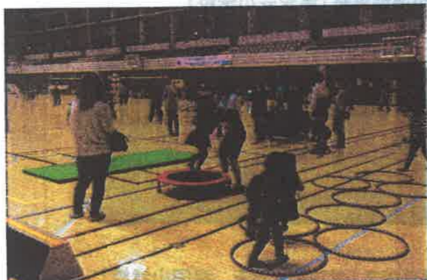
ふれあいフェスタ2017 幼児器具体操