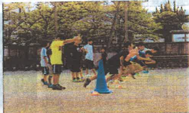
夏休みかけっこ短期講座